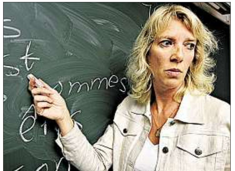
For å få ned sykefravær på blant lærer må man se på om sykdom skyldes arbeidsmiljøet.

en skole må man se på om dette skyldes arbeidsmiljøet på skolen eller andre årsaker. Eksempel 1: Hvis en skole har mange lærere med barn under 12 år, kan en del fravær skyldes pass av syke barn, noe som ikke har noe med arbeidsmiljøet å gjøre. Eksempel 2: Noen kan trenge en operasjon, og dette har heller ikke noe med arbeidsmiljøet å gjøre. Eksempel 3: Noen kvinnelige lærere blir sykmeldt i løpet av svangerskapsperioden. På vår skole har sykefraværet omtrent vært på samme nivå